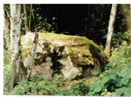
Rytinė "Pinigų kalno" akmenų pusė.